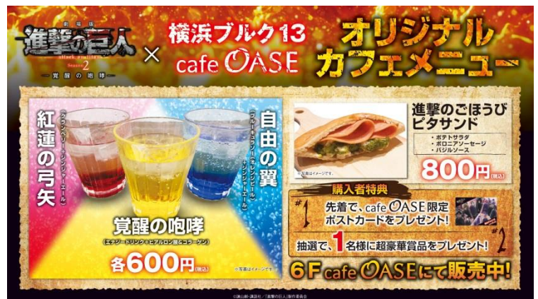
(C) 諫山創・講談社 / 「進撃の巨人」製作委員会